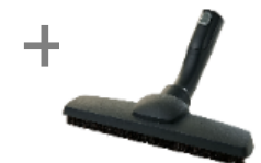
AERO PRO™ Parketto Pro