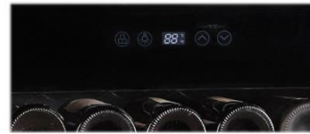
Elektronische Temperatur Einstellung